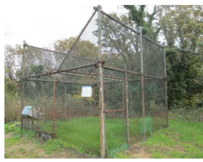
鳥取市 カラスの捕獲檻