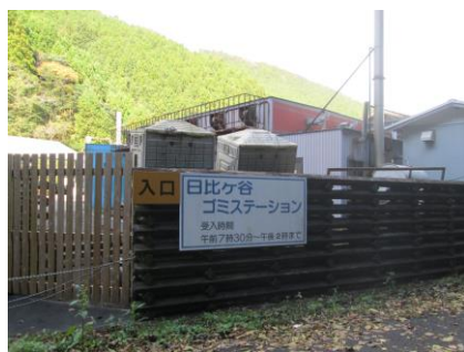
上勝町 ゴミステーション

11月20日 8:00 ホテル発。ユネスコ世界遺産にも指定されている鳥取砂丘を散策してから9:30 鳥取市福部支所へ。農作物へのカラスの被害を防ぐため、カラスの罠を実際設置し、効果をあげている事例について、しくみ、ラッキョウ畑が広がる檻の設置状況、運営の実際、課題等を説明頂いた。10:30 帰路に就く。18:30 豊丘着。