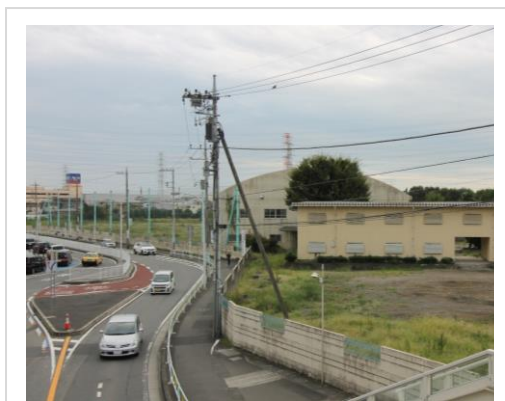
4月に移転した相原高校

大正12年設立 地域の人が愛されてきた 農業高校が移転 篤志家20数名が土地 と資金を寄付し、神奈川県 立農蚕学校として設立 され、現在は畜産農産物の 生産から販売まですべてを 学ぶことができる。幼稚園 や保育園、小学校の生徒 たちも動物とのふれあいや 農業体験などを行ない、市 民にとっては『心のオアシス』 になっていた。教育委員会に 『移転させないで』署名50 00筆を提出するも。 下伊那農業高校が移転となっ たら、皆さんどうしますか?