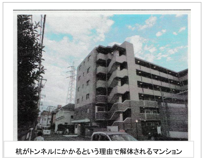
杭がトンネルにかかるという理由で解体されるマンション

知らされたのは昨年で、 あまりに急であり住民たち は困惑している。 地下3層構造の駅施設 深さ30m 幅約50m 幅長さ約900m、大部分 は地上から掘削する。